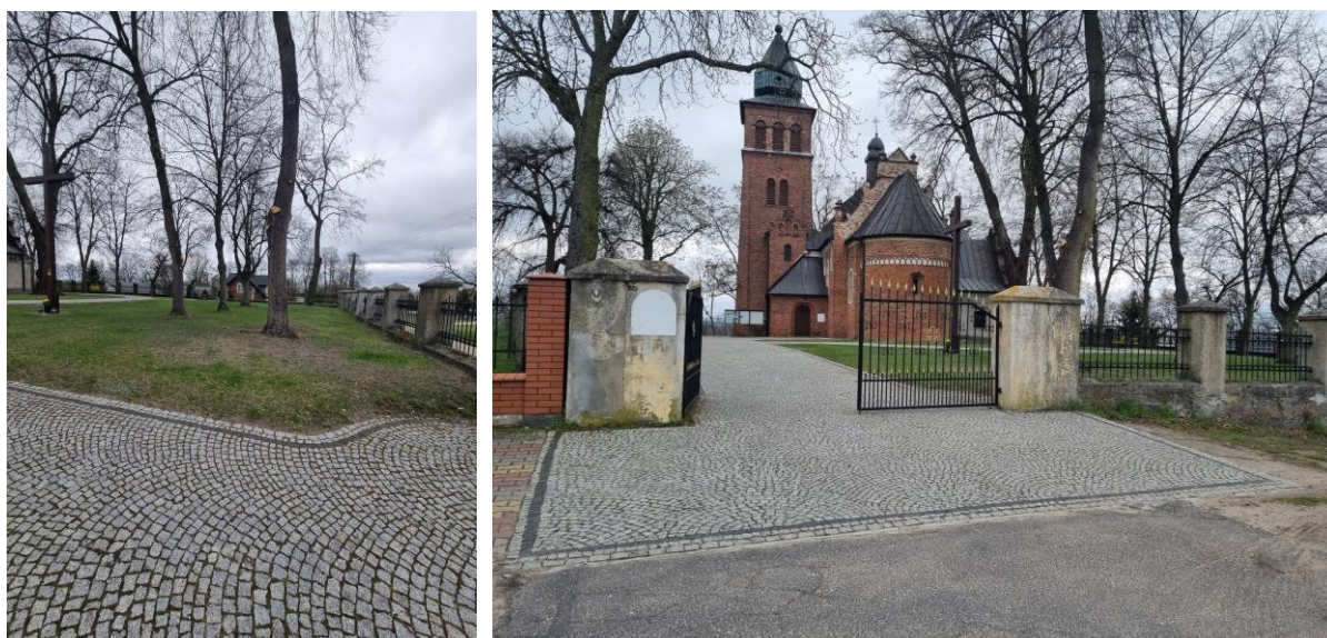
Fotografia 12. Widok na cmentarz oraz ogrodzenie cmentarza przykościelnego w Strońsku.

Cmentarz przykościelny w granicach ogrodzenia z ogrodzeniem w zespole kościoła parafialnego w Strońsku - cmentarz założony w 1 poł. XIII w., ogrodzenie wykonane w XIX w. Cmentarz w granicach kościoła parafialnego pw. Św. Urszuli i Jedenastu Tysięcy Dziewic w Strońsku. Droga pokutna na terenie cmentarza wykonana z kostki brukowej. Na terenie cmentarza liczne starodrzewy. Stan zachowania cmentarza – dobry. Należy przeprowadzić prace remontowe ogrodzenia cmentarza. Cmentarz objęty ochroną poprzez wpis do Wojewódzkiej Ewidencji Zabytków Województwa Łódzkiego.