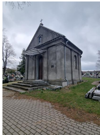
Fotografia 5. Widok na kaplicę cmentarną pw. Św. Krzyża w Strońsku.

Obiekt objęty ochroną poprzez wpis do Rejestru Zabytków Województwa Łódzkiego.