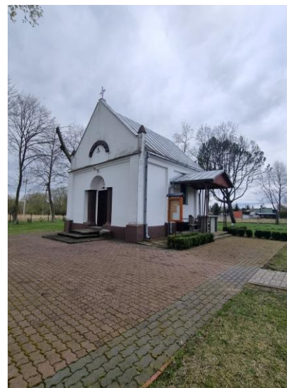
Fotografia 4. Widok na kaplicę dworską w Rembieszowie.

We wnętrzu zobaczyć można barokowy ołtarz pochodzący z XVII w. Na ołtarzu znajduje się obraz Matki Boskiej z Dzieciątkiem namalowany na przełomie XVII i XVIII w.