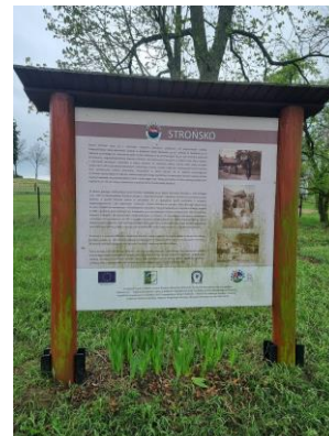
Fotografia 1. Widok na tablicę informacyjną opisującą miejscowość Strońsko.

Na terenie gminy znaleźć można tablice informacyjne opisujące historie poszczególnych miejscowości, czy cenne obiekty z terenu gminy Zapolice.