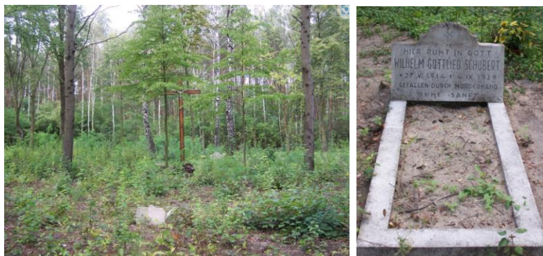
Fotografia 13. Widok na cmentarz ewangelicki w Holendrach.

porządkowych i pielęgnacyjnych. Cmentarz objęty ochroną poprzez wpis do Wojewódzkiej Ewidencji Zabytków Województwa Łódzkiego.