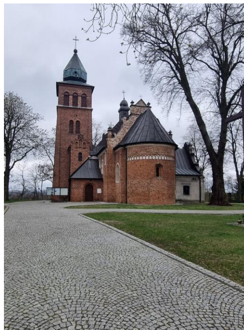
Fotografia 3. Widok na kościół Parafialny Pw. Św. Urszuli i Jedenastu Tysięcy Dziewic w Strońsku.

Obiekt objęty ochroną poprzez wpis do Rejestru Zabytków Województwa Łódzkiego.