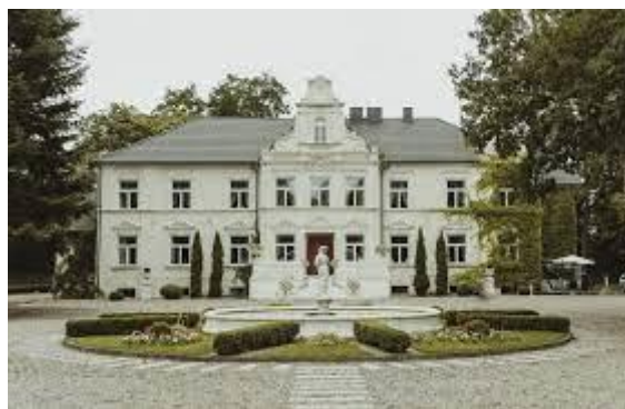
Fotografia 7. Widok na dwór w Pstrokoniach.

Dwór murowany, tynkowany. Budynek piętrowy, podpiwniczony, przykryty dachem czterospadowym z trzypiętrową wieżą w narożniku północno – zachodnim i facjatą na osi po stronie północnej, zbudowany na planie wydłużonego prostokąta. Elewacja frontowa dziewięcioosiowa z trzyosiowym ryzalitem zwieńczonym trójkątnym szczytem z wolutami po bokach.