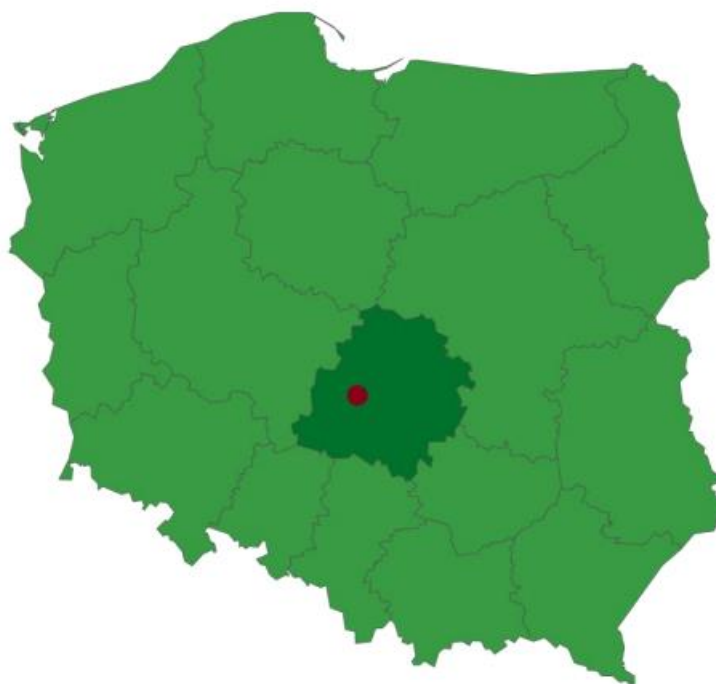
Rysunek 1. Lokalizacja Gminy Zapolice na obszarze Polski.

Lokalizacja gminy na tle Polski została przedstawiona na poniższym rysunku.