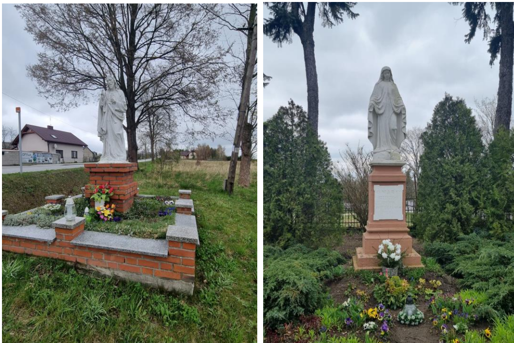
Fotografia 10. Przykład kapliczek na terenie miejscowości Strońsko – od lewej przydrożna Figura Najświętszego Serca Pana Jezusa naprzeciwko cmentarza w Strońsku oraz Figura Matki Boskiej w pobliżu kościoła w Strońsku.

Kapliczki przydrożne możemy spotkać w każdej miejscowości na terenie gminy Zapolice.