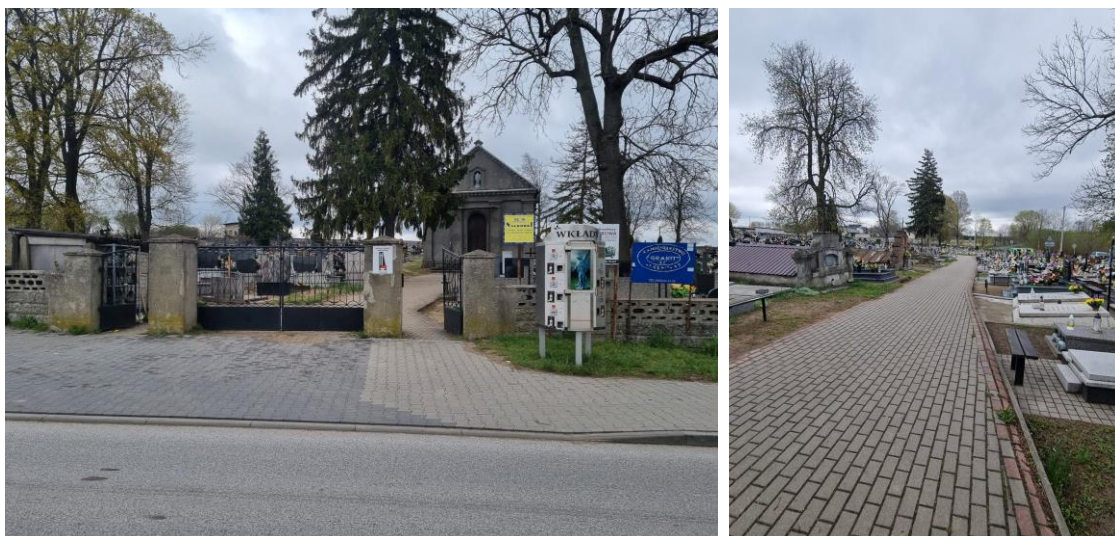
Fotografia 11. Widok na bramę wejściową cmentarza parafialnego w Strońsku (od lewej) oraz ścieżkę komunikacyjną na terenie cmentarza (od prawej).

Cmentarz przykościelny w granicach ogrodzenia z ogrodzeniem w zespole kościoła parafialnego w Strońsku - cmentarz założony w 1 poł. XIII w., ogrodzenie wykonane w XIX w. Cmentarz w granicach kościoła parafialnego pw. Św. Urszuli i Jedenastu Tysięcy Dziewic w Strońsku. Droga pokutna na terenie cmentarza wykonana z kostki brukowej. Na terenie cmentarza liczne starodrzewy. Stan zachowania cmentarza – dobry. Należy przeprowadzić prace remontowe ogrodzenia cmentarza. Cmentarz objęty ochroną poprzez wpis do Wojewódzkiej Ewidencji Zabytków Województwa Łódzkiego.