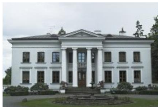
Fotografia 6. Widok na pałac w Paprotni.

Obiekt objęty ochroną poprzez wpis do Wojewódzkiej Ewidencji Zabytków Województwa Łódzkiego.