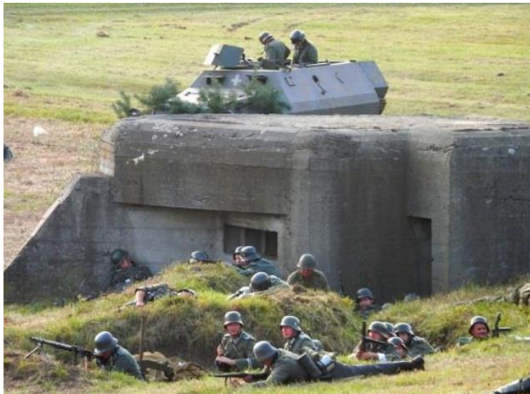
Fotografia 2. Widok na inscenizację historyczną z wydarzeń z września 1939 r. na terenie gminy Zapolice.

W trakcie inscenizacji odtwarzana jest scena ataku niemieckich zwiadowców na polską obsadę bunkra CKM. Na polu bitewnym obserwatorzy mogą dostrzec oryginalną armatę przeciwlotniczą Boforsa, a także CKM Browinga oraz samolot obserwacyjno-łącznikowy, który cały czas lata nad miejscem inscenizacji.