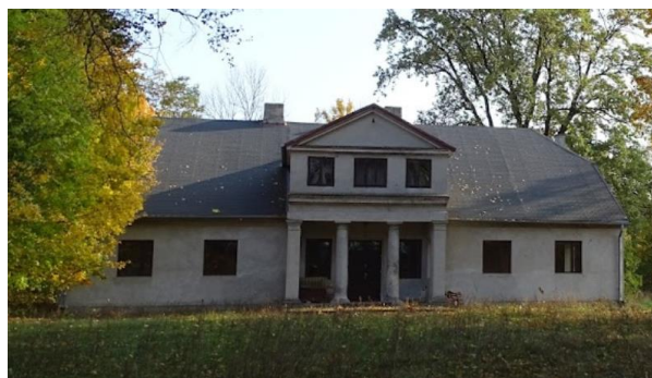
Fotografia 8. Widok na dwór w Kalinowej.

Budynek jest parterowy na planie prostokąta. Na osi znajduje się portyk wsparty na kolumnach, a nad nim mansarda zwieńczona tympanonem. Kolumny, okrągłe w przekroju, spoczywają na prostych bazach i mają skromnie zdobione głowice. Budowla jest zorientowana fasadą na zachód - nietypowo biorąc pod uwagę czas, w którym powstała.