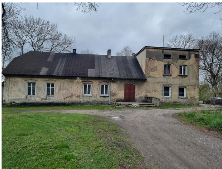
Fotografia 9. Widok na Dwór w Ptaszkowicach.

Dwór stanowi własność gminy Zapolice. Obecnie pełni funkcję mieszkań komunalnych.